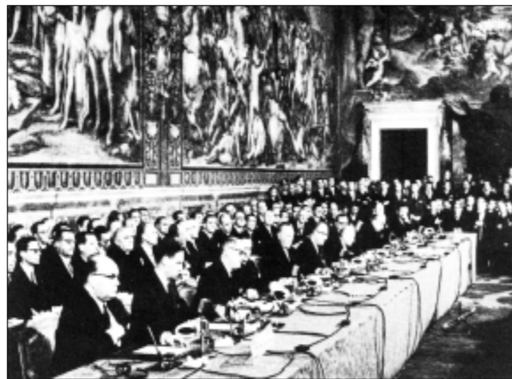
ROMA, 25 MARZO 1957: LA FIRMA DEI TRATTATI

In questi anni abbiamo assistito a troppi casi di incarichi pubblici affidati a persone senza alcuna preparazione specifica. Per governare le persone occorre studio, riflessione e capacità; amministrare un Comune, una Regione, lo Stato non è cosa facile perché riguarda lo sviluppo integrale dell'uomo.