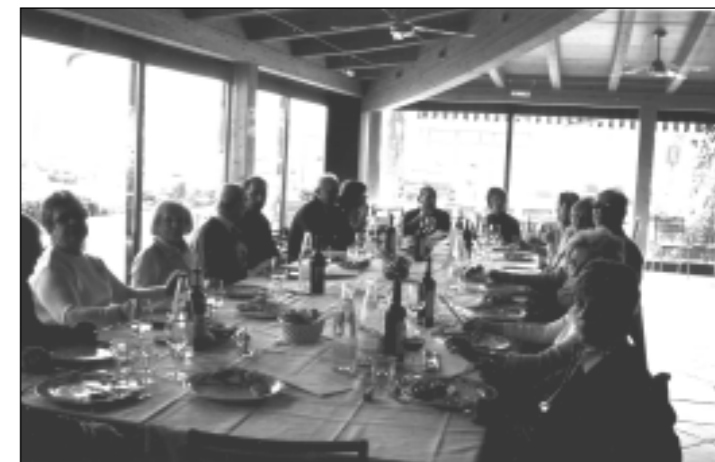
GITA A BRESCIA: IL MOMENTO CONVIVIALE

Messaggi o richieste urgenti possono essere inviati al numero telefonico 0382.33646 fax 0382.309767